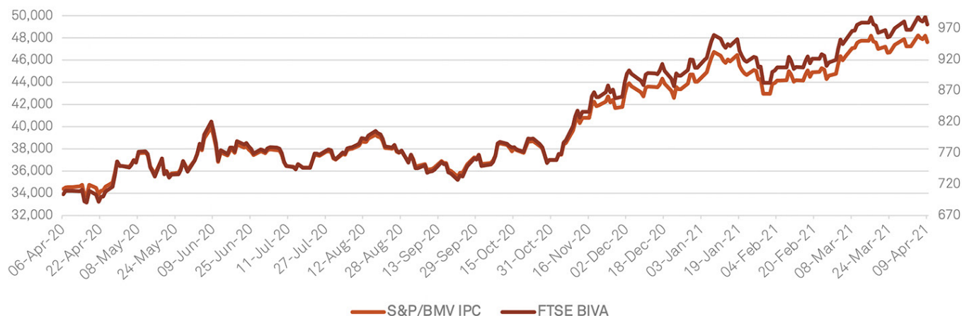
S&amp;P/BMV IPC vs FTSE BIVA