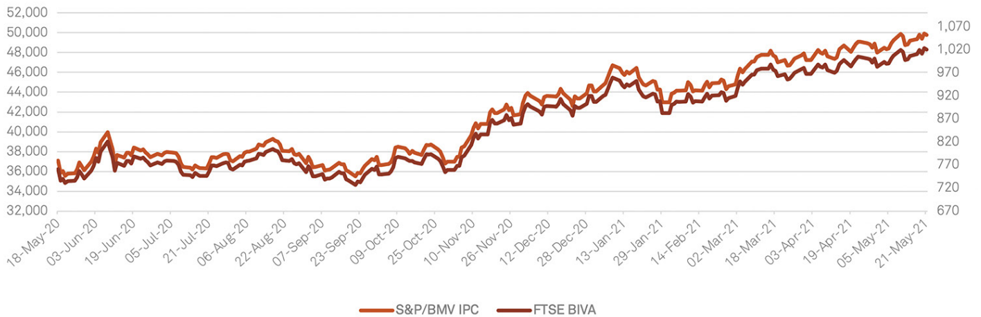
S&P/BMV IPC vs FTSE BIVA