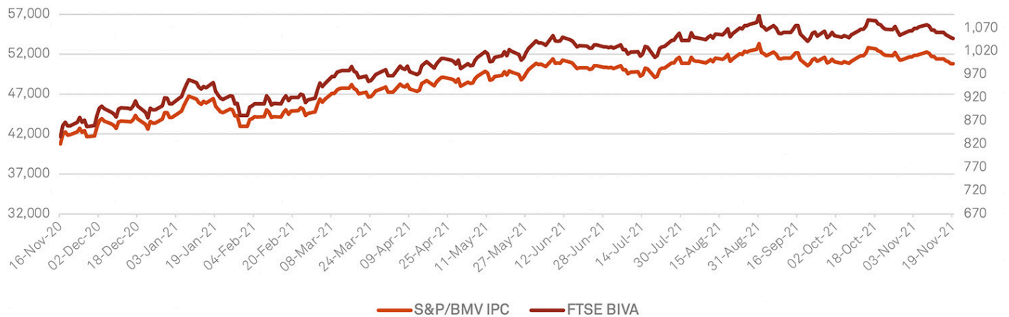
S&amp;P/BMV IPC vs FTSE BIVA